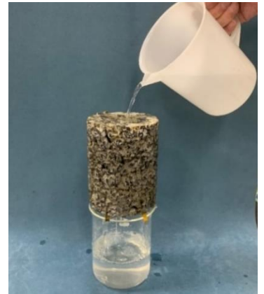
透水性地盤改良体