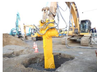
透水性改良体造成状況