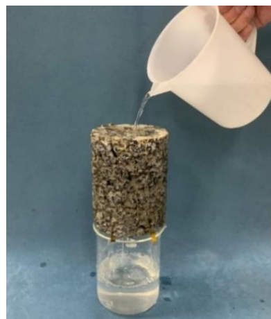
透水性地盤改良体 透水係数 k=1.0 \times 10^{-3} \text{m/sec}