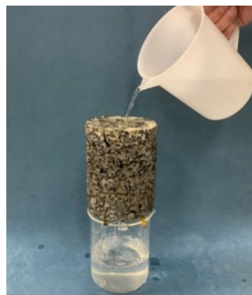
透水性地盤改良体

2種類の地盤改良体を組み合わせた補強工法 で豪雨・地震による盛土の不安定化を抑制します。