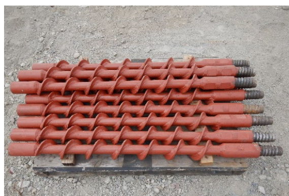
スクリューロッド