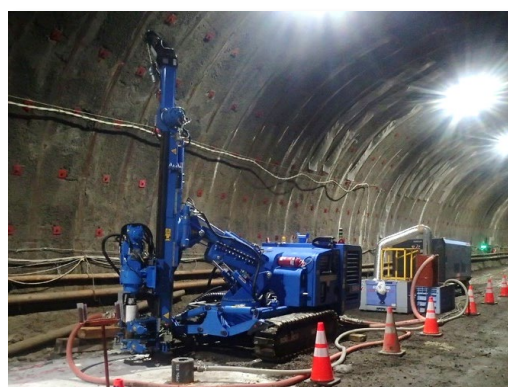
実トンネル内での試験施工状況