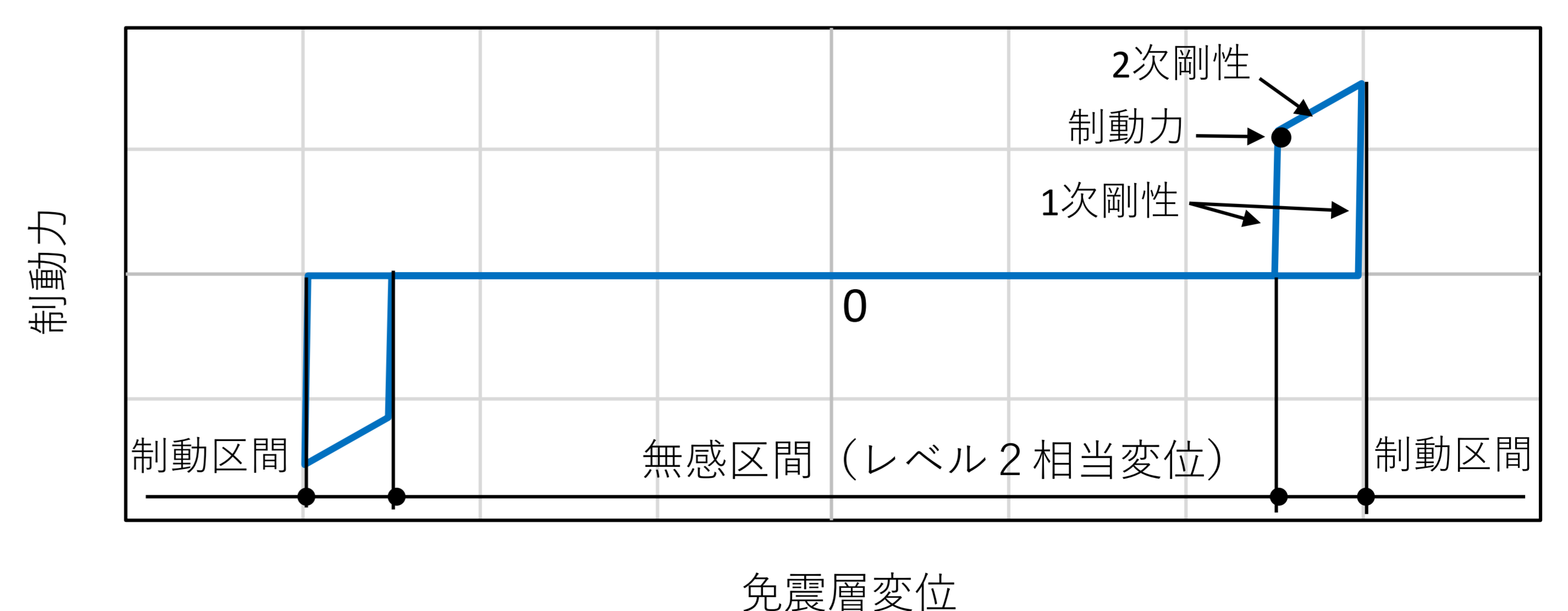
フェイルセーフ制動装置の復元力特性