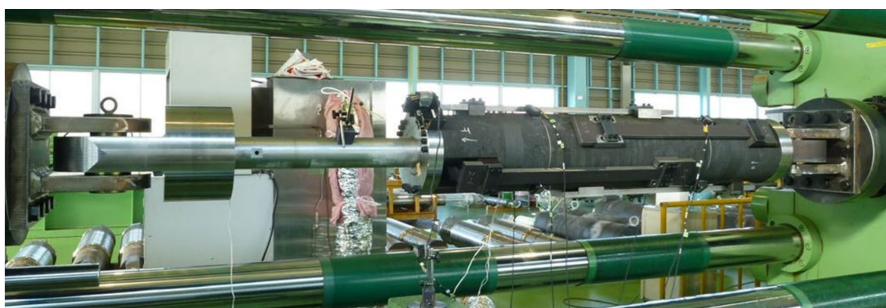
フェイルセーフ制動装置の加力試験状況