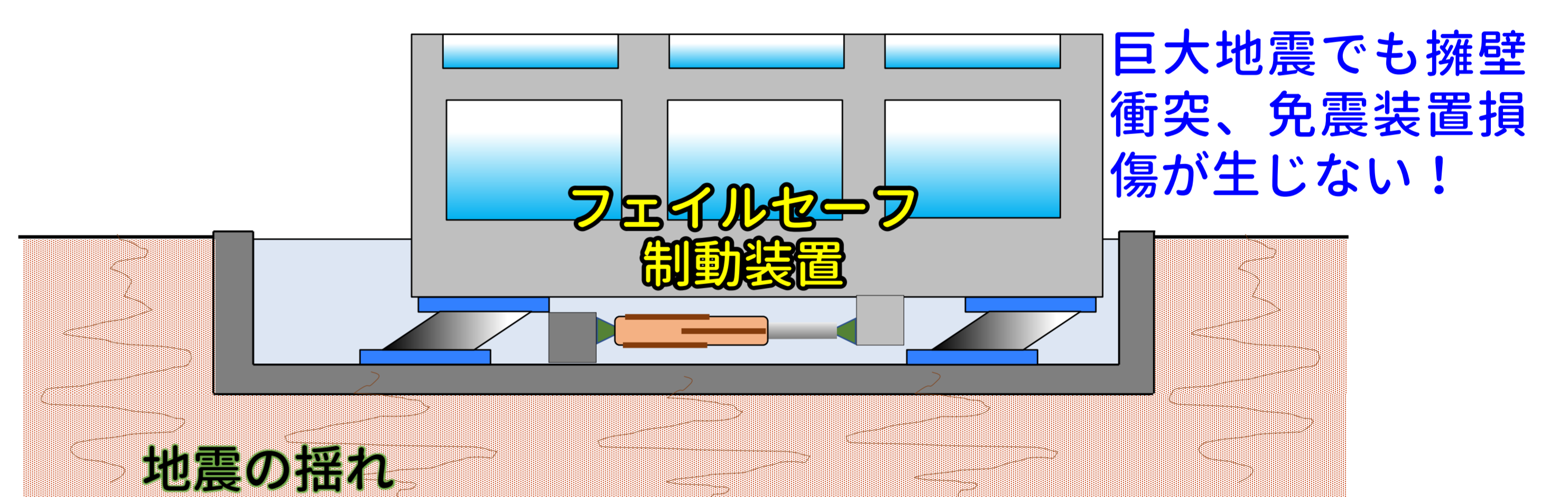
巨大地震を考慮した免震フェイルセーフ構造