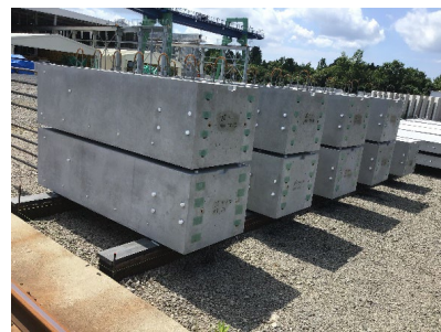
低炭素型プレキャストコンクリート 品質・コストは従来と同等以上で 低炭素性を実現