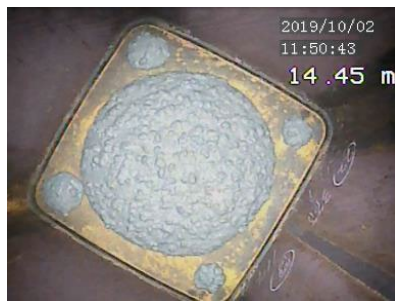
CFT柱の充填コンクリート 高強度・高流動な低炭素コンクリート