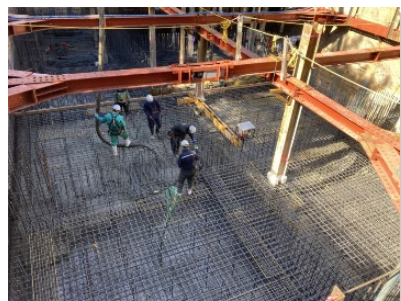
現場打ち低炭素コンクリート 基礎躯体への適用