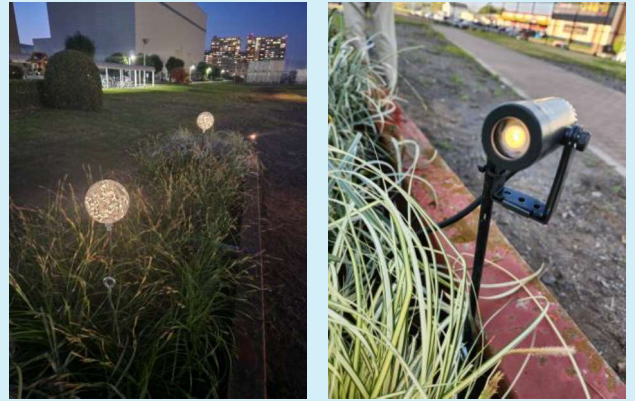
安藤ハザマ技術研究所 (実証実験)

植物の光合成と微生物の代謝により光エネルギーを電力に変換します。植物が育つ土壌や水辺に電極を挿しておくだけで電源がなくても、植物が元気に育つ環境があれば電力を得ることができる未来のシステムです。